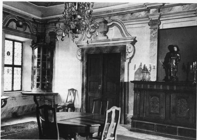
Steinsaal des Hauptschlusses in Neunhof (Detailansicht). Der im 18. Jahrhundert umgestaltete Gartensaal diente zwischen 1611 und 1650 als Gottesdienstraum für die reformierten Christen aus Nürnberg und Umgebung.

reformierten Flüchtlingsgeistlichen die Stadt, die verwaisten reformierten Christen übernahmen nun selbst die Initiative und schlossen sich 1650, 2 Jahre nach dem Westfälischen Frieden, der ihre Konfession endlich gleichberechtigt neben Katholizismus und Luthertum im Reich stellte, zu einer Gemeinde zusammen. Der Weg zu ihrer endgültigen Anerkennung und Gleichbehandlung sollte noch mit mancherlei Schwierigkeiten verbunden sein. So wurde den Reformierten erst im Jahre 1800 mit der Marthakirche ein Gotteshaus innerhalb der Stadtmauern zugestanden.