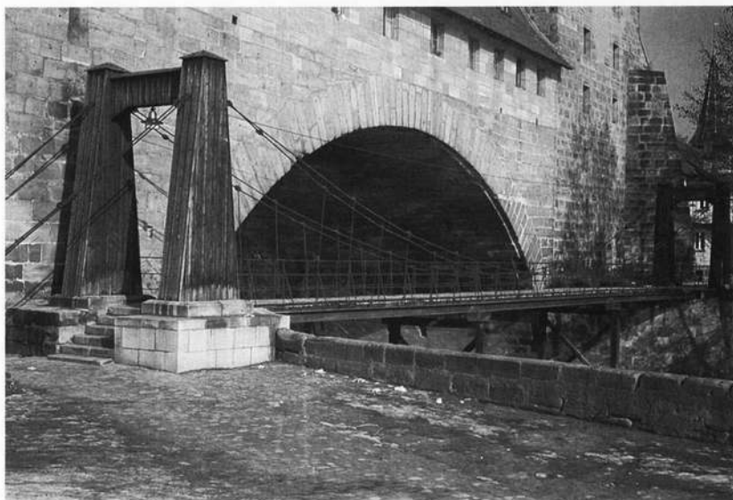
Der um 1820 errichtete "Kettensteg" in Nürnberg, Deutschlands erste freischwinge Flußbrücke und Vorläufer späterer Eisenbahnbrücken

Industrie skeptisch gegenüberstand ( Im Dampfe lösen sich auf die Verhältnisse alle ). Zwar hatte Ludwig I. als Kronprinz dem Fürther Bürgermeister Bacumen 1825 erklärt, daß er an einer Bahnverbindung Nürnberg – Fürth interessiert sei; wahrscheinlich dachte er aber dabei an eine Pferdebahn. Tatsächlich wurde die Ludwigsbahn nach ihrer Eröffnung 1835 sowohl als Pferdebahn wie als Dampfbahn betrieben. Den Auftakt zum Eisenbahnzeitalter signalisierte der um 1820 errichtete Kettensteg in Nürnberg, Deutschlands erste freischwinge Flußbrücke, zugleich Vorläufer späterer Eisenbahnbrücken. Erbauer war der Mechanikus J. G. Kuppler. Von ihm stammt bereits 1833 die Darstellung des Streckenverlaufs (Trasse) Nürnberg – Fürth und er war es auch, der als Erster in Deutschland Vorlesungen über Eisenbahnen am Nürnberger Polytechnikum (heute Simon-Georg-Ohm-Fachhochschule) hielt. Zeitweise war der für den Bau der Ludwigsbahn mitentscheidende Johan-