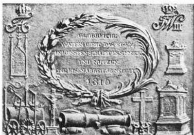
Neujahrspaket 1816 der Kgl. Eisengießerei Berlin mit der ersten in Deutschland gebauten Lokomotive