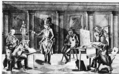
Polsterei der Natur zeichnung von Schindler

Wichtiger ist aber ein Anderes. Neben Künstlern – und Kunstliebhabern –, Zivil- und Militärbaumeistern, Ingenieuren und Geometern bildete die Schule Tausende von Handwerkern nicht nur im besseren Geschmack, sondern in höchst praktischen Dingen. Zeugnis davon geben eine Reihe von technischen Zeichnungen, von Baurissen und Geräten, und nicht zuletzt die Lehrbücher. Letztere sind in der Ausstellung soweit möglich vertreten. Sie sind in ihrer Wirkung auf Handwerk und Gewerbe,