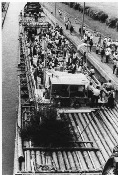
Große Floßfahrt 1986. Das 83m lange und ca. 9m breite Floß mit Gästen an der Schleuse in Schweinfurt.

„Der Franken-Reporter“ Fremdenverkehrsverband Franken e.V., Postfach 269, 8500 Nürnberg 81