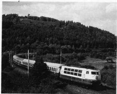
Intercity-Zug der Deutschen Bundesbahn – bespannt mit einer elektrischen Lokomotive der Baureihe E 102 bei Heigenbrücken im Spessart (Strecke Aschaffenburg – Würzburg)