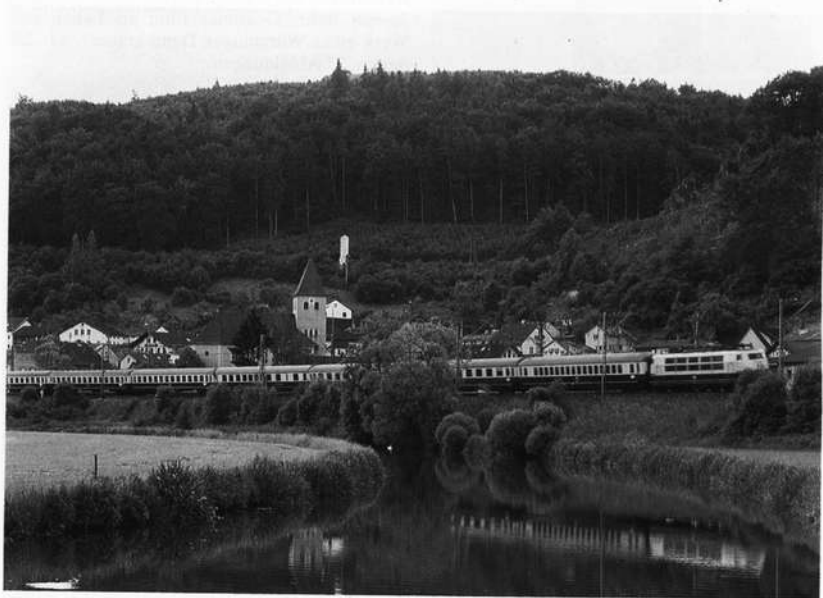
Intercity-Zug der Deutschen Bundesbahn – bespannt mit einer elektrischen Lokomotive der Baureihe E 103 – im Altmühltal (Strecke Treuchtlingen – Ingolstadt)