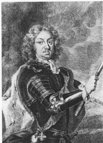
George Wilhelm Erbprinz von Bayreuth St. Keyserl. Maj. und des Franckischen Reiches General über die Cavallerie

Der Gründer von St. Georgen am See, Erbprinz Georg Wilhelm. Die Vorliebe für England spiegelt sich in der englischen Schreibung des Georg-Vornamens