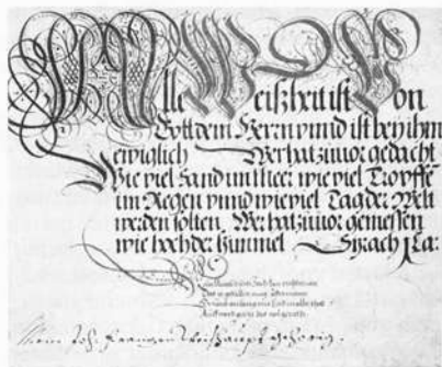
Initialen (in Bayreuth)