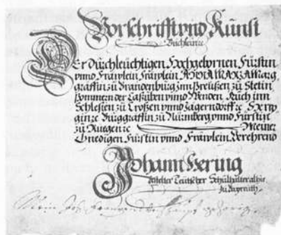
Widmungsblatt (in Bayreuth)

Erschien auch in „Unser Bayern“ Heimatbeilage der Bayer. Staatszeitung 33 – 1984, 96-98.