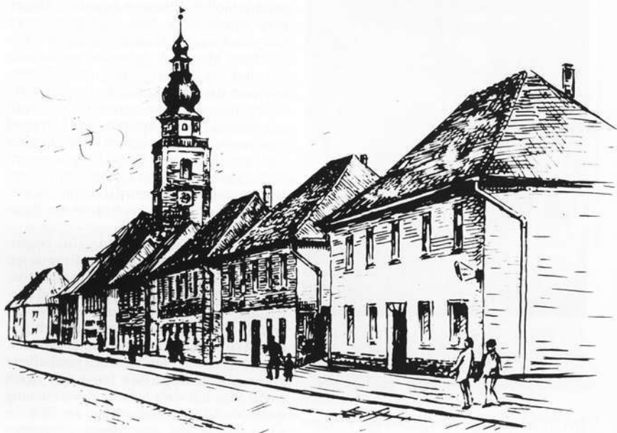
St. Georgen mit Ordenskirche

Mancher Besucher der Bayreuther Festspiele mag sich schon gewundert haben, wenn er unweit des „Grünen Hügels“ durch Bayreuths Stadtteil St. Georgen gegangen und auf Namen wie „Seestraße“, „Matrosengasse“ und „Insel“ gestoßen ist, obwohl sich von einem See nicht die geringste Spur finden läßt. Wegweiser informieren den Ortsfremden, daß sich an den Altbaukern St. Georgens das heutige Industriegebiet Bayreuths anschließt. Und genau auf diesem erst seit Kriegsende erschlossenen und bebauten Areal unterhalb der Hohenwarte, die früher einmal der Brandberg hieß, befand sich von 1508 bis 1775 ein großer Weiher, den man anfangs den Brandberger, später aber – wohl wegen des herr-