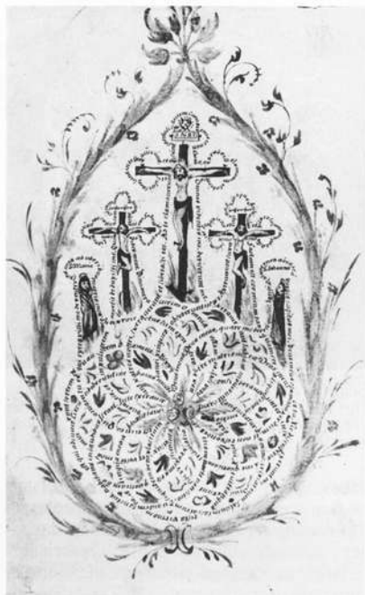
Kreuzigungsgruppe. Staatsbibliothek Bamberg Signatur: J. H. art. msc. 65, fol 78.

Sein Bayreuther Codex stammt von 1616; es handelt sich um eine Sammlung von besonders schönen Prunkschriften mit schönen, jedoch überladenen Initialen und einigen Gebrauchsalphabeten der Zeit. Gewidmet ist die Handschrift (heute im Besitz des Historischen Vereins) der 1609