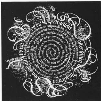
Schriftkreisel. Staatsbibliothek Bamberg Signatur: J. H. msc. art. 65, fol 19.

sches, dann ein weißer Schriftkreisel auf schwarzem Papier, ein Briefkonzept von 1634, mehrere farbige Schriftbilder (darunter ein Reichsadler, von Schriftbändern umgeben), und einige großformatige Schriftmusterblätter, die am oberen Rand Klemmspuren zeigen. Anscheinend hat Hering auf den großen Märkten Kulmbachs an einem Stand solche Musterblätter ausgehängt und dadurch Kundschaft fürs Briefeschreiben angelockt – was damals durchaus üblich war. Es ist also ein recht buntes Bild, das die beiden Handschriften bieten, durchaus ein Querschnitt durch die langjährige Arbeit eines Schreibmeisters, der zwar nicht zu den Spitzen seines Fachs zu zählen ist, aber doch zu den Könnern. Die Schriftproben im Bayreuther Codex, u. a. die großen Initialen, stehen in der Tradition Nürnberger Schreibschulen, besonders Johann Neudörffers des Älteren, eines Zeitgenossen Dürers; sie sind aber sichtlich noch wenig ausgeformt, überladen, mit Goldtinte unterlegt und mit einem Netz von Schattenstrichen, das eher verwirrt als informiert. Je kleiner seine Schrift wird, desto unsauberer werden die Buchstabenformen; so gerät er dann leicht von der Fraktur in die Bastarda. Anders die Bamberger Handschrift: Hier leben die Initialen nicht mehr von der