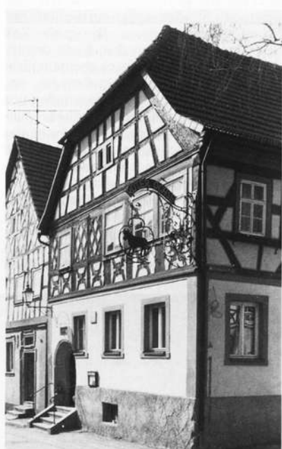
Gasthof "Zum Roten Ochsen" in der Flenderstraße

Auch Bauart und Baubefund der erhaltenen Ackerbürgerhäuser des 16. und 17. Jahrhunderts bestätigen mit ihren Hoftoren