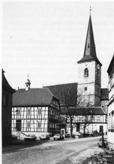
Blick durch die Luitpoldstraße zum Rathaus und zur Stadtpfarrkirche St. Johannes Baptista

ließ am 9. April 1945 auf dem Turm der Kirche eine weiße Fahne hissen und ging den anrückenden Amerikanern entgegen.