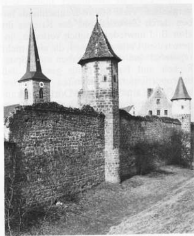
Teilstück der erhaltenen Stadtmauer im Osten

auf der östlichen Talseite sinnvoll genutzt wurde. Ebenso wird hier, wie bei anderen alten Städten, die Wechselbeziehung zwischen Stadt und Straße erkennbar. Zum einen gab es als Ost-West-Achse die von Coburg kommende und nach Ebern führende Altstraße, die seit 1492 als Geleitstraße bezeugt ist. Sie führte durch das Hattersdorfer Tor – beziehungsweise seinen Vorgänger – in die Stadt, vorbei an der Pfarrkirche über den Markt, und zog zum Rothenberger Tor, um dann die Rodach mit ihren beiden Übergängen in Richtung Heilgersdorf zu überschreiten. Das geschah beim Hauptarm des Flusses sicher schon frühzeitig mit einer Holzbrücke, die später durch eine Steinbrücke ersetzt wurde, nach der Inschrift seit 1574.