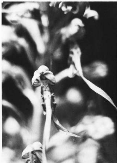
Einzelblüte von Himantoglossum hircinum

Das zarte erste Laubblatt der künftigen Orchidee entwickelt sich im Frühjahr des vierten Lebensjahres, die Speicherknolle im Sommer des gleichen Jahres. Der Sommer des fünften Jahres ist durch den Ab-