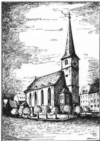
St. Gertraud (einst und jetzt wieder). Bild: Societas pro arte Herbipolensis. Freie Vereinigung zum Schutze der Kunstwerke Würzburg – Franken

Der Name des Pleicherviertels – noch bis in die neueste Zeit eine eigenständige und originale Vorstadt Würzburgs – kommt von der Pleichach, einem gelegentlich recht kräftigen Bach. Die "Pleich", wie das Viertel von seinen Bewohnern genannt wird, ist die Abkürzung des Bachnamens "Bleichaha" und bedeutet Bleichwasser und dürfte wohl bis in die karolingische Zeit zurückgehen. Bleichwasser deshalb, weil das von Wiesen umgebene Gewässer, mit diesen zusammen zum Wäschebleichen diente. Es floß, nach der Vereinigung der Bäche Riederbach und Wertbach bei Unterpleichfeld an Mühlhausen, Maidbronn, Rimpar und Versbach vorbei bzw. hin-