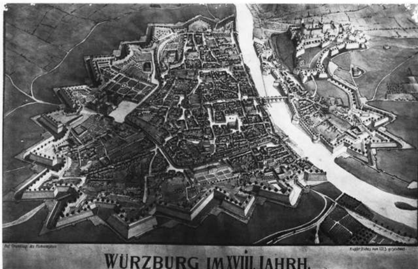
Würzburg um 1723. Zeichnung nach dem Homann-Stich.