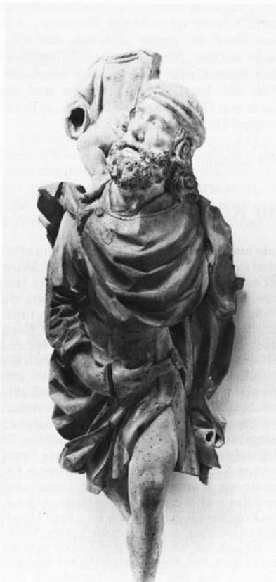
Hl. Christopherus (Fragment) Adam Kraft, Nürnberg, um 1490

Bamberg: Ausstellung "Frühe Bergvölker in Armenien und Kaukasus", Historisches Museum (Alte Hofhaltung) 1. 7. bis 19. 8. 84. Öffnungszeiten: Dienstag–Samstag 9–12 / 14–17 Uhr, Sonn- und Feiertage 10–13 Uhr, Montag geschlossen.