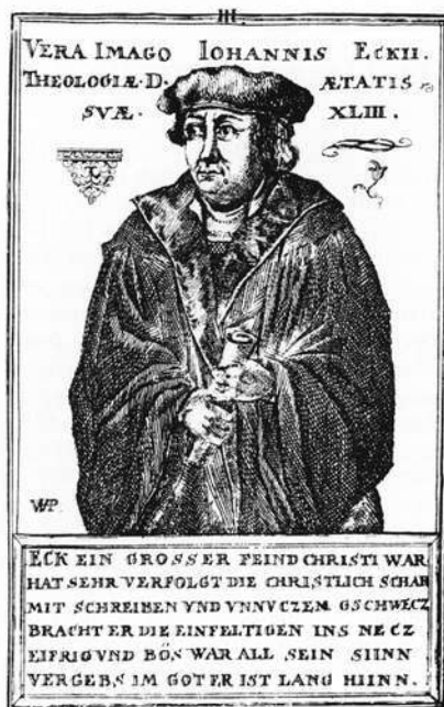
Dr. Johannes Eck, Kupferstich

Vor diesem Hintergrund mag begreiflich erscheinen, welche Bedeutung Dr. Eck und die bayerischen Herzöge der Universität Ingolstadt im konfessionellen Ringen beimaßen, wie an der Tatsache der Verlesung der Bulle "Exsurge Domine" in der Universität noch vor ihrer Verkündigung in den Ingolstädter Pfarrkirchen, an der Verkündigung des 1. bayerischen Religionsmandats vom 5. März 1522 durch die Universität oder am Beispiel des Senatsbeschlusses deutlich wird, daß alle der lutherischen Lehre verdächtigen Studenten dem Rektor anzuzeigen seien.