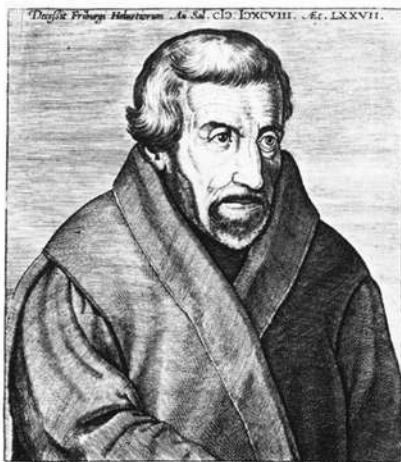
PETRUS CANISIUS NEOMAGVS SOC. IESV THEOLOGVS.

Alphons Salmeron in Ingolstadt ein, 1525 bis 1556 trat dann nochmals eine Zäsur in der jesuitischen Präsenz ein. Der Standort Ingolstadt für eines der ersten jesuitischen Kollegien in Deutschland (Köln 1544, Wien 1552, Trier 1560, Dillingen 1563) war in mehrfacher Hinsicht bedeutsam: Die Jesuiten gewannen entscheidenden Einfluß an der Universität, nahmen theologische Professuren wahr, 1585/8 kam die Fakultät an sie, ohne daß freilich Ingolstadt zu einer ausschließlichen Jesuitenuniversität geworden wäre. Das Ingolstädter Jesuitenkolleg entwickelte sich zu einem geistigen Zentrum des Ordens, es war ein Bollwerk der Gegenreformation, Ingolstädter Theologen gewannen europäische Bedeutung. Noch während des ganzen 18. Jahrhunderts war es das weitaus größte Kolleg der Oberdeutschen Provinz mit den mit Abstand meisten Studiosi. Es war weiterhin ein geistig-politisches Zentrum der katholischen Erneuerung im Herzogtum Bayern.