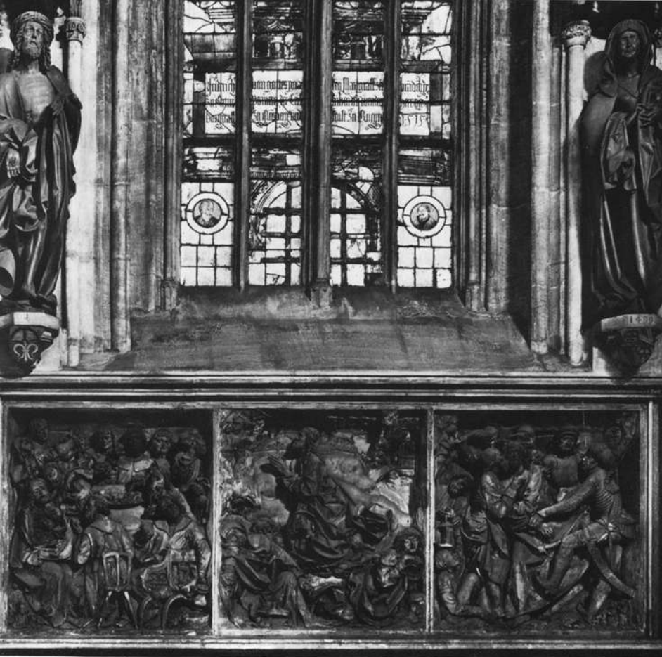
Abb. 1: Volckamersche Gedächtnisstiftung, 1499. Nürnberg, St. Sebald

nicht mehr zu verlassen. Dieser ihm sichtbar anhaftende Makel der Unehrenhaftigkeit wird auch Folgen für seinen Werkstattbetrieb gehabt haben, in dem er wohl eine Zeit lang keine Gesellen und Lehrlinge mehr beschäftigen konnte.