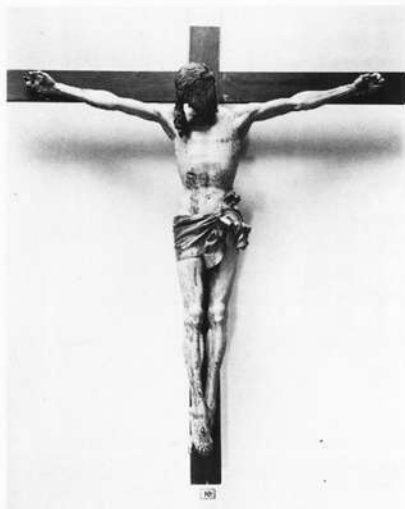
Abb. 2: Heiligeist-Kruzifix, ca. 1505–1510. Nürnberg, Germanisches Nationalmuseum

Hauptes. Der kraftvolle Gestus der weit ausgespannten Arme und des straffen axial ausgerichteten Körpers beinhaltet gleichzeitig jedoch den Hinweis des Sieges über den Tod. In der Ausdifferenzierung der feingliederigen Körperpartien läßt der Künstler sein Bemühen um die anatomisch korrekte Wiedergabe der Körperfunktionen erkennen. Gleichfalls lassen die Maßverhältnisse zwischen den Körperpartien und das Quadrat, das dem Kruzifix als ideelles Flächenmaß zugrunde liegt, die Einflüsse der Renaissance erkennen. Während der Veit-Stoß-Ausstellung im Sommer werden vier weitere Kruzifixe in der Kartäuserkirche des Germanischen Nationalmuseums ausgestellt sein: die Kruzifixe aus St. Sebald und St. Lorenz, die als verbürgte Werke des Veit Stoß gelten; der Kruzifix von der Nürnberger Burg und der Kruzifix aus Jengen im Ostallgäu. Die Raphael-Tobias-Gruppe im Germanischen Nationalmuseum (Abb. 3) wurde 1516 von Veit Stoß geschnitzt und befand sich ursprünglich in der Dominikanerkirche zu Nürnberg. Ein Bericht aus dem Jahre 1737 erwähnt die