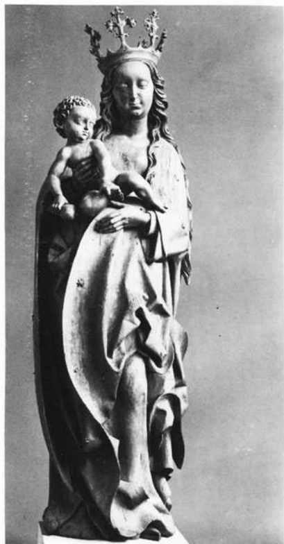
Abb. 5: Hausmadonna von der Wunderburggasse 7, ca. 1519. Nürnberg, Germanisches Nationalmuseum

Maria von links. Mit seiner rechten Hand führt er den Segensgestus aus, der in seiner Ausrichtung nach oben gleichzeitig auf seinen göttlichen Auftrag hinweist. In seiner linken Hand hält der Erzengel ein Zepher, um das ein Spruchband gewickelt ist, auf dem einzelne Buchstabenfolgen des Englischen Grußes, das "Ave Maria gratia plena" sichtbar sind. Maria ist in ein eng anliegendes Untergewand gekleidet, über dem sie einen weiten Mantel trägt. Ihre rechte (heute erneuerte) Hand hat Maria vor die Brust gelegt, aus der linken Hand entgleitet ihr als Folge des Schreckens über die Erscheinung des himmlischen Boten