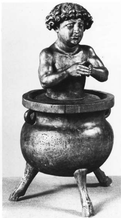
Abb. 6: Hl. Veit im Ölkessel, 1520. Nürnberg, Germanisches Nationalmuseum

Nach einem bewegten Leben starb Veit Stoß hochbetagt und fast erblindet um den 20. September des Jahres 1533. Seine sterblichen Überreste fanden in einem bescheidenen Grab auf dem Johannisfriedhof in Nürnberg ihre letzte Ruhestätte. Viele seiner Werke haben die Jahrhunderte überdauert und können uns heute eine Vorstellung vermitteln von der historischen Situation einer blühenden Handelsmetropole an der Wende vom Mittelalter zur Neuzeit.