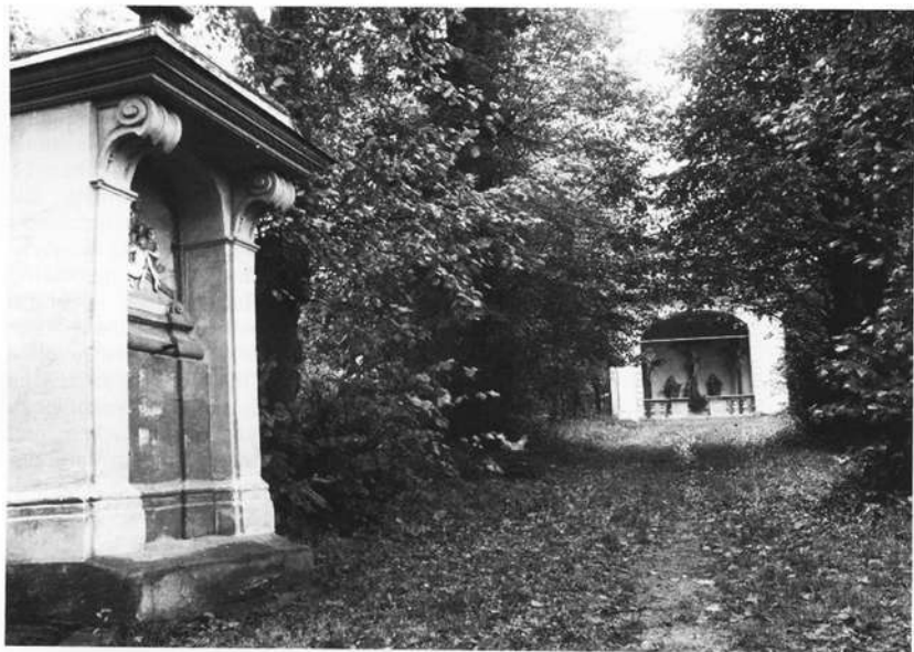
Kalvarienberg bei Schnaittach