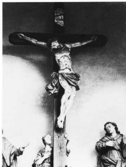
Kalvarienberg bei Schnaittach

gesehen, dem Prediger gleichsam eine Mittelstellung zu zwischen dem Gekreuzigten und dem in der Verklärung erhöhten Christus. Die Predigt soll somit eine Verbindung darstellen zwischen dem irdischen Leid und die Überwindung in der Auferstehung.