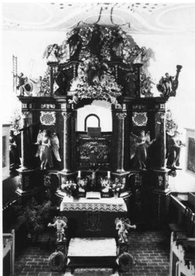
Kanzelaltar in der Klaussteinkapelle (in der Nähe der Burg Rabenstein im oberen Ailsbachtal)

Die geistige Beweglichkeit Dosers unterstreicht die Gestaltung des Altars der Klaussteinkapelle in der Fränkischen Schweiz, nahe der Burg Rabenstein im