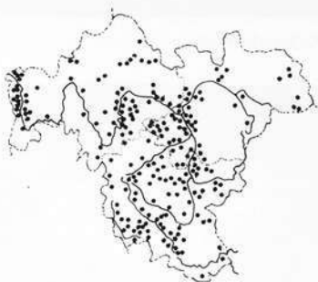
Abb. 9: Verbreitung des Weißstorchs in Franken um 1850