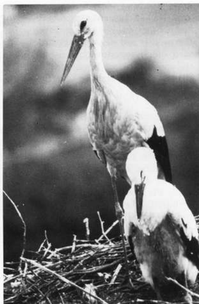
Abb. 14: Altstorch mit Jungtier (Vach)

Nahrungsangebot: Die Nahrung wird in den Regnitzauen sowie an den Weihern der nahen Umgebung (Kriegenbrunn, Erlangen, Herzogenaurach) gesammelt. Eingbracht werden: Regenwürmer, Frösche, Echsen, Weißfische (Abb. 12 u. 13).