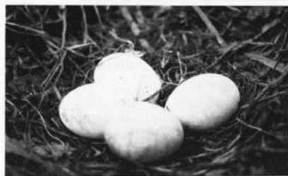
Abb. 3: Typisches Gelege eines Weißstorches

Seine Flügelspannweite beträgt — je nach Geschlecht — zwischen 1,7 m und 1,9 m, seine Größe zwischen 80 cm und 100 cm. Als Gewicht bringt er etwa 4000 g