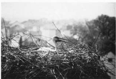
Abb. 11: Brütender Weißstorch im Vacher Horst