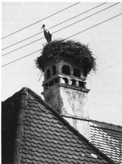
Abb. 17: Baiersdorfer Horst mit unmittelbarer Verdrahtungssituation

Nahrungsangebot: Regenwürmer, Frösche, Echsen, Weißfische; das Einsammeln der Nahrung erfolgt in den Regnitzauen sowie an den Erlanger Weihern.