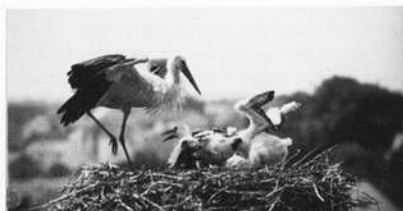
Abb. 12-13: Fütterung auf dem Vacher Horst

Jahr/Zahl der Jungstörche: 1970/3, 1971/1, 1972/4, 1973/2, 1974/1, 1975/2, 1976/3, 1977/1, 1978/1 und zwei unbefruchtete Eier, 1979/3 und ein unbefruchtetes Ei, 1980/3 und drei unbefruchtete Eier, 1981/3. Gesamtzahl der geborenen Jungstörche seit 1970: 27.