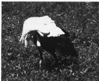
Abb. 6: Gefiederpflege

Mit der Ablage des ersten Eies beginnen beide Geschlechter abwechselnd mit der Bebrütung; das Weibchen brütet stets während der Nacht. Die gesamte Brutdauer beträgt 30 Tage. Während dieser Zeit sorgt immer der brütende Storch für ein Wenden der Eier im Gelege. Diese werden in zeitlichen Abständen von 15 bis 20 Minuten gedreht, wobei gleichzeitig der Nestboden mit dem Schnabel gelockert und umgeschichtet wird. Kurz vor dem Schlüpfen der weißbedunten Jungstörche