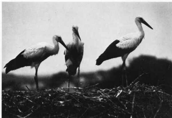
Abb. 4: Weißstorch, Jugendstadien; Übergang zum erwachsenen Tier

einige typische Storchenhörste in der Nürnberger Umgebung.