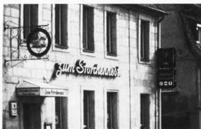
Abb. 16: Horstlage

Der Horst ist seit mehr als 100 Jahren besetzt; die nachfolgende Übersicht zeigt den Bruterfolg auf diesem Horst seit 1970 an: