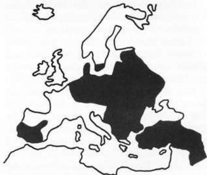
Abb. 7: Verbreitungskarte für den Weißstorch in Europa

Irgendwann beginnen dann die Jungvögel auf ihrem Horst, z. B. während einer Windböe, mit Flugübungen. Sie üben —