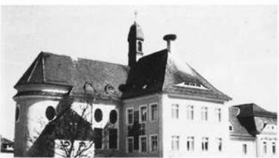
Abb. 18: Gremsdorfer Storchennest