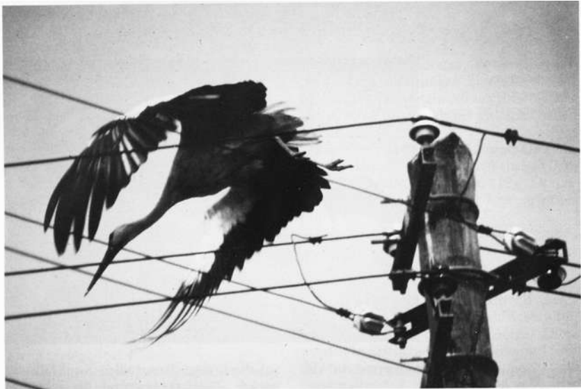
Abb. 2: Fliegender Weißstorch. Zugleich zeigt diese Aufnahme die den flugunerfahrenen Jungstörchen drohende Gefahr, die durch die Verkabelung der Landschaft immer mehr zunimmt