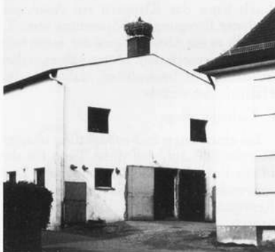
Abb. 15: Horstlage

Besondere Gefahr droht den Jungstörchen durch die Hochspannungsleitungen in den Regnitzauen. Diese Gefahr sowie die Schwierigkeiten bei der Nah-