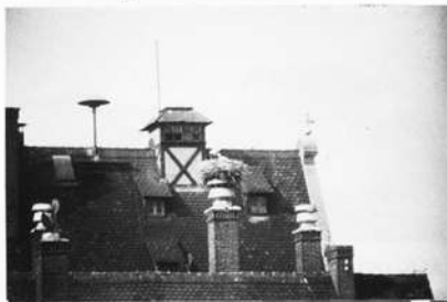
Abb. 10: Lage des Vacher Storchhorstes