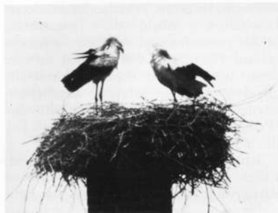
Abb. 5: Begrüßungsverhalten

Hilfe — als auch natürlich, d. h. durch das Tier angelegt sein.