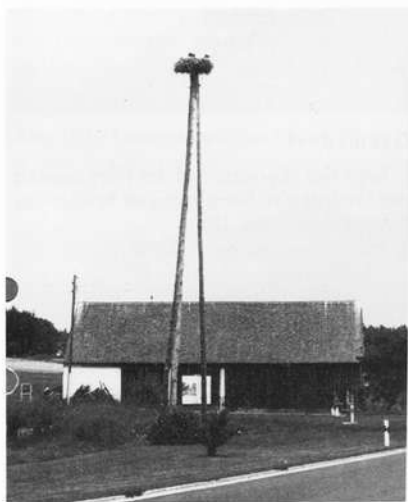
Abb. 19: Horstlage

Ziegler, T.: Bestand und Brutverlauf des Weißstorches in Franken. (Mündliche Mitteilung).