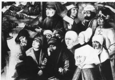
Predigt des Hl. Johannes, Gruppe der Gläubigen