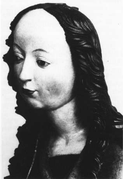
Hl. Maria, Kopf seitlich von rechts

Eichstätt in diesem Jahr lediglich die Mensa einweihen, damit das Abhalten von Messen möglich wurde.