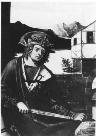
Der Hl. Martin teilt den Mantel