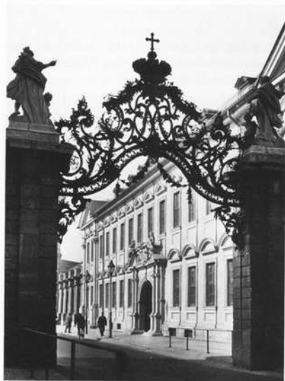
Tor am Rennwegerring

Würzburg, das ist die Stadt, in der ein Mathis Nithart, genannt Grünewald, zur Welt kam, in der ein Tilman Riemenschneider wirkte — als Bildhauer und Bürgermeister —, in deren Lusakgärtlein beim Neumünster Herr Walther von der Vogelweide begraben liegt und in der schließlich die größte Baustelle des Barock in Europa aufgemacht wurde, die Residenz.