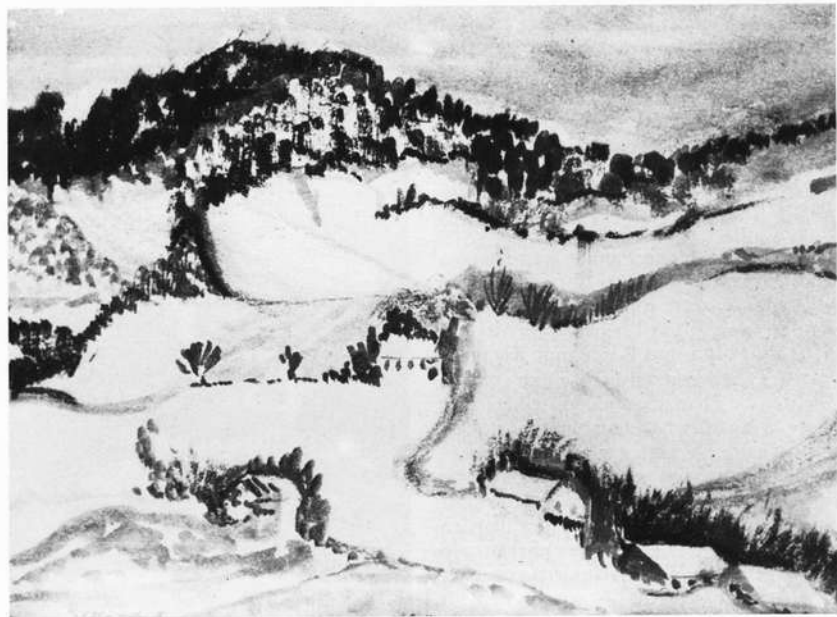
Winterliches Land (Aquarell)

Eulen gehört — außerhalb des Wassertrogs auf Steinen sitzen. Droben im Baum singt eine pechschwarze Amsel mit goldgelbem Schnabel unbekümmert ihr Lied zu Ende, bevor sie den Standort wechselt und vom nahen Hausdach aus einen neuen Gesang in den Nachmittag schickt. Aus der Terrassenecke betrachtet eine Nixe — akrobatisch mit schuppigem Fisch-Unterleib auf einem menschengesichtigen Stier sitzend — das seltsame Idyll am Wassertrug. Sie wiederum wird nicht aus dem Auge gelassen von einem etwas abseits stehenden gehörnten Kentaur. Ein mit geschnäbelten Keramik-Dauernietern überbesetztes Keramik-Vogelhaus verunsichert die in Büschen und Bäumen aufgeregt schilpnde Spatzenhorde. Keramik-Pilze stehen starr und bedürfnislos neben pflegebedürftigen Topfpflanzen. Phantasie und Wirklichkeit gehen draußen wie drinnen eine gute Verbindung ein. Im Haus kobolzen tönerner Gebilde umher.