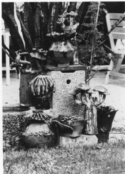
Früchte und Pilze (Keramik).

Eulen gehört — außerhalb des Wassertrogs auf Steinen sitzen. Droben im Baum singt eine pechschwarze Amsel mit goldgelbem Schnabel unbekümmert ihr Lied zu Ende, bevor sie den Standort wechselt und vom nahen Hausdach aus einen neuen Gesang in den Nachmittag schickt. Aus der Terrassenecke betrachtet eine Nixe — akrobatisch mit schuppigem Fisch-Unterleib auf einem menschengesichtigen Stier sitzend — das seltsame Idyll am Wassertrug. Sie wiederum wird nicht aus dem Auge gelassen von einem etwas abseits stehenden gehörnten Kentaur. Ein mit geschnäbelten Keramik-Dauernietern überbesetztes Keramik-Vogelhaus verunsichert die in Büschen und Bäumen aufgeregt schilpnde Spatzenhorde. Keramik-Pilze stehen starr und bedürfnislos neben pflegebedürftigen Topfpflanzen. Phantasie und Wirklichkeit gehen draußen wie drinnen eine gute Verbindung ein. Im Haus kobolzen tönerner Gebilde umher.