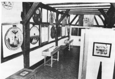
Das Museum im Ochsenhof: Blick in die stadthistorische Sammlung.