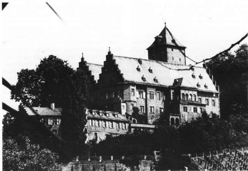
Schloß Mainberg bei Schweinfurt, wo ein ausgedehnter Weinberg neu angelegt wurde

Daß Schweinfurt übrigens auch ein bekannter Wein-Handelsort war, steht außer Zweifel. Kein Geringerer als Johann Wolfgang von Goethe hat aus Schweinfurt