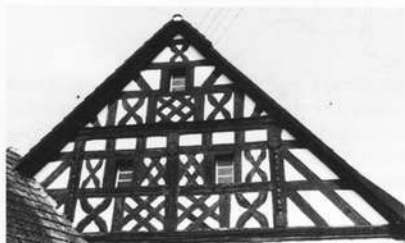
Das im Giebel des Wohnhauses der Hainbronner Farbmühle erhaltene kunstvolle Fachwerk erinnert an seine Vergangenheit — Getreidemühle bis zum 1927 Umbau