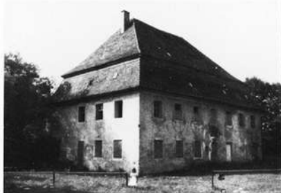
Ehemaliges Hammerherrenhaus in Rauhenstein a. d. Pegnitz