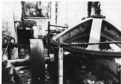
Kraftübertragung im Turbinenhaus des Farbwerks Rauhenstein

kranz ist mit eingeschlagenen Hartholzzähnen bestückt. Bei plötzlich auftretenden Störungen im Kraftübertragungssystem brachen nur leicht ersetzbare Holzzähne aus, während die weiteren Zahnräder aus Metall keinen Schaden erlitten. Bei der Kraftübertragung der senkrechten Wasserräder wurde die gleiche Methode angewandt.