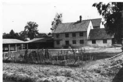
Betriebsgebäude des Farbwerks Eichenmüller in Hainbronn (links die Trockenhalle)