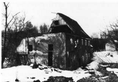
Die Espamühle bei Gunzendorf — verfallene Farbmühle

Der Bergbau auf Farberden kam mit der Zeit fast völlig zum Erliegen. Für die Farbmühlen des oberen Pegnitzgebietes, die nur einen geringen Teil der abgebauten Erden verarbeiteten, nahte ebenfalls das