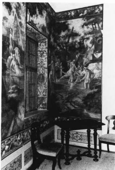
Wandbespannung mit mythologischen Darstellungen in der Götterstube des Hauptschlösses Neunhof