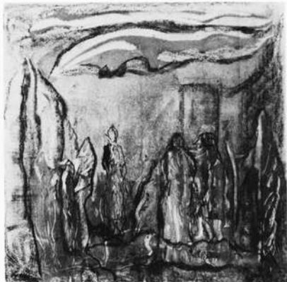
Verhüllte Gestalten, Farbmonotypie