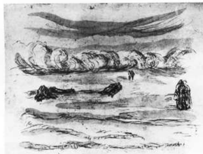
Auf der Wiese, Radierung/Tusche