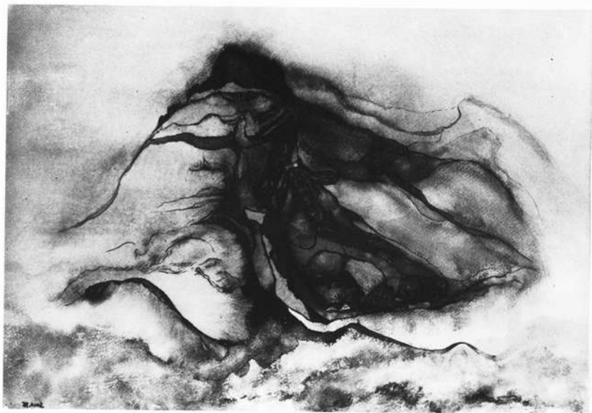
Großer Berg, Aquarell