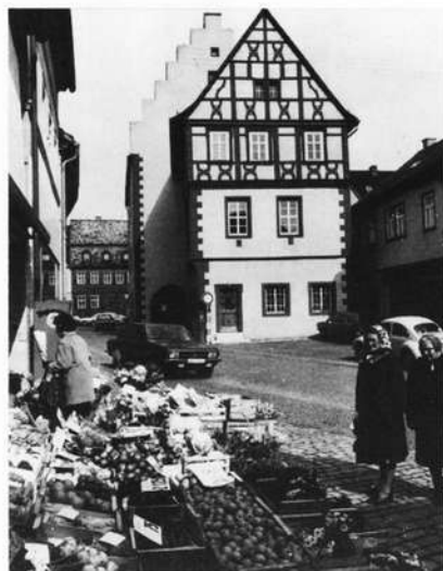
Gerolzhofen: Blick von der Spitalstraße auf das Museum Altes Rathaus

Mit großer Freude heißen wir namens des Historischen Vereins in Gerolzhofen e. V. die Beiratsmitglieder zu ihrer Tagung in Gerolzhofen willkommen. Dieser sicher mit entsprechender Publizität verbundene Besuch hilft unserem jungen erst in diesem Jahr gegründeten Verein wieder ein wenig weiter für die Ziele tätig zu sein, die uns mit dem Frankenbund eng verbinden: Der Förderung von Verständnis und