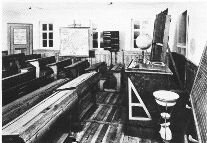
Gerolzhofen: Museum Altes Rathaus. Sitz des ersten bayerischen Schulmuseums: Klassenzimmer — Druckreproduktion — (Deutsch, Gerolzhofen)