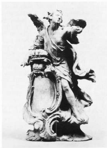
Johann Peter Wagner: Modellfigur eines Engels mit Wappenkartusche, um 1765/70 (Mainfränk. Museum Würzburg, auch Foto)

Aus Anlaß des 250. Geburtstages des Würz- burger Hofbildhauers Johann Peter Wagner