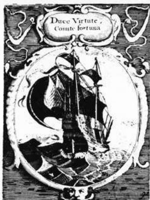
Kupferstich aus EMBLEMATA POLITICA, Nürnberg 1640. Stadtgeschichtliche Museen Nürnberg (dort als Briefkarte, schwarz-weiß, für DM —,35 zu haben)

Nicht zuletzt noch: gute Laune, Liebe Worte, frohe Lieder Soll der Schlüssel Euch erschließen, Setzt Ihr Euch mit Freunden nieder.