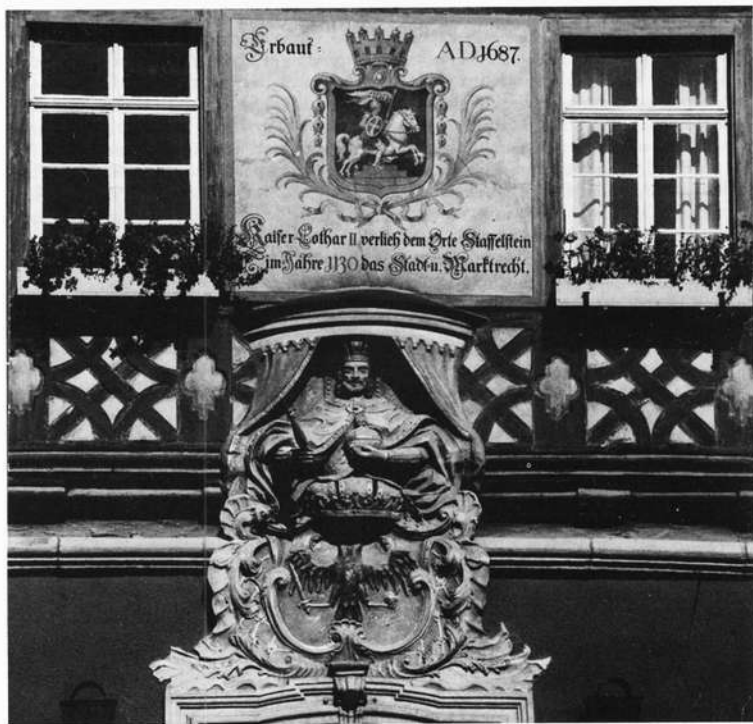
Am Rathaus in Staffelsein