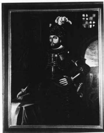
Walter von Cronberg, 1527-1543 Hoch- und Deutschmeister, der erste der Mergentheimer Zeit. Ölbild im Deutschordensmuseum Bad Mergentheim.