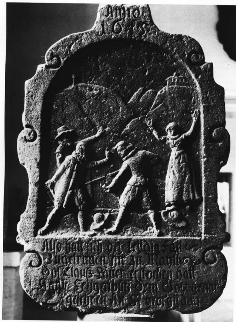
Bildstock, sog. „Feigenbutzerle“, Mergentheim 1629. Deutschordensmuseum Bad Mergentheim.