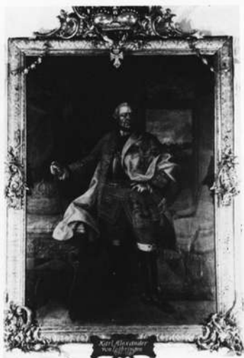
Karl Alexander Herzog von Lothringen, Hoch- und Deutschmeister 1761-1780. Ölbild im Deutschordensmuseum Bad Mergentheim.