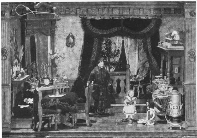
Deutschordensmuseum Bad Mergentheim: Puppenstube, um 1880/90, sog. „Teutsche Renaissance“. Sammlung Johanna Kunz.

Deutschordensstruppen und von sämtlichen Traditionsnachfolgern. Als Leihgabe wurde bei der Eröffnung dieser Abteilung auch die Fahne des III. Batl. Deutschmeister-Infanterieregiments 152 Marienburg (Tannenbergfahne) übergeben.