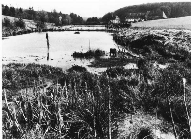
Teichlandschaft in der Nähe von Ebrach im Anschluß an einen Fischweiher. Hier ist der Eisvogel zu Hause, hierher kommen die Reiher, und in den Gewässern lebt eine vielseitige Tierwelt. Auch Hartriegel, die Schilffarten und andere, selten gewordene Pflanzen haben hier noch einen Standort.

Der sehenswerte 30-Minutenfilm „Weiher, Naturschutzprobleme in einer alten Kulturlandschaft“, von dem Nürnberger Kameramann Heinz Ehrenkäufer in