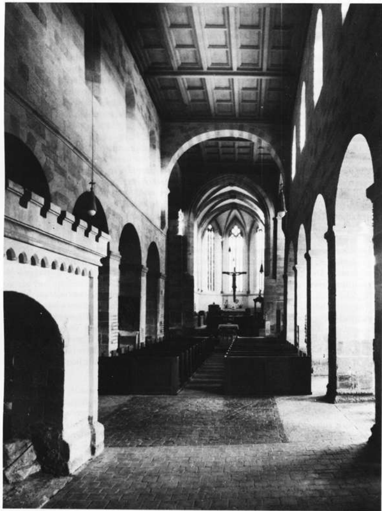
Klosterkirche, restauriert, Fußboden tiefergelegt; links: Walburgiskapelle

Eine schöne Ergänzung des Kreuzgangs wurde uns in den Resten eines Freskenzyklus an der Südwand des Südflügels wiedergeschenkt — Ausschnitte aus der Passion Christi: Kreuztragung, Kreuzigung, Kreuzabnahme. Der Geist der Dürerzeit ist spürbar; es ist wohl ein Meister des 16. Jahrhunderts am Werk. Vielleicht ist diese Malerei das letzte sichtbare Dokument des Klosters vor der Reformation! In der Erhaltung und Festigung dieser Reste hat uns Kirchenmaler Wiedel einen besonderen Dienst erwiesen.