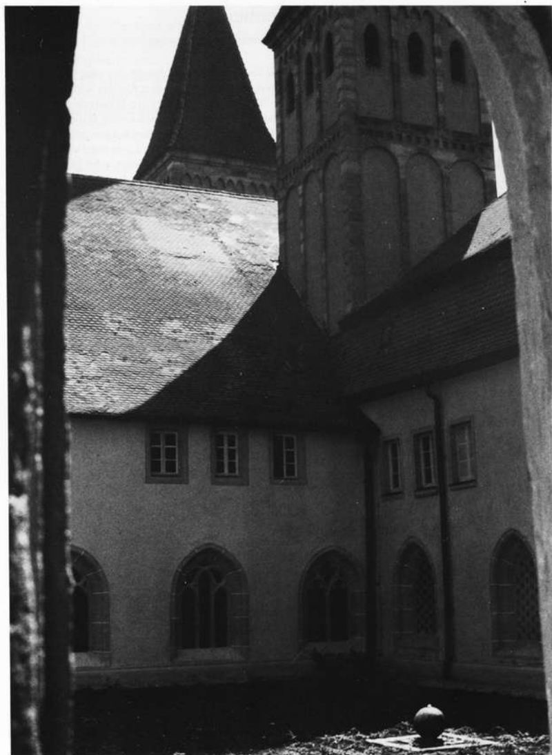
Heidenheim Kreuzgang mit Türmen der Klosterkirche