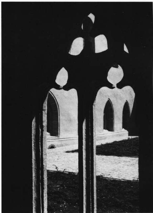
Heidenheim: Restaurierter Kreuzgang