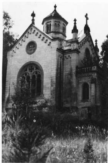
Mausoleum bei Ziegelsdorf