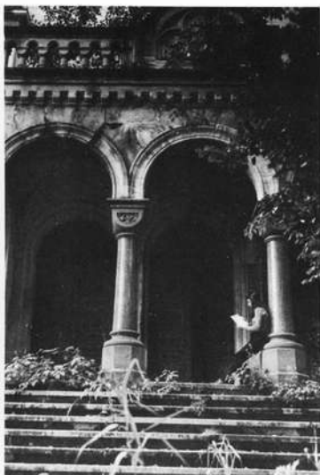
Freitreppe mit Portal zum Mausoleum