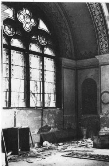
Eines der beiden weitgehend zerstörten Fenster