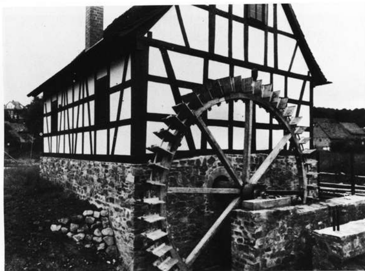
Die verpflanzte Ölmühle in Mömbris nach dem Wiederaufbau

Im Jahre 1830 zählte Anton Rottmayer in seinem statistisch-topographischen Handbuch für den Untermain-Kreis im Kahlgrund nicht weniger als 73 Mühlen auf. Nach dem Zweiten Weltkrieg wurden allein im Mömbriser Gewerberegister noch sechs Mühlenbetriebe im Raum Mömbris-Strötzbach geführt. Die letzten Mühlenbetriebe im ehema-