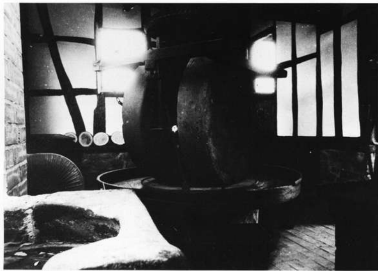
Kollergang und Ofen

Gleichzeitig ließ die Gemeinde Mömbris in der Werkstätte des Aschaffburger Bildhauers Hermann Reichert einen Bildstock aus dem 18. Jahrhundert restaurieren, der an