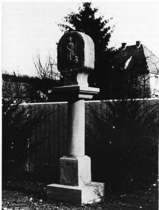
Ein alter Bildstock wurde restauriert und fand vor der Ölmühle einen neuen Standort