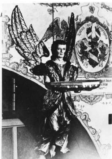
Taufengel des Wolfgang Adam Knoll 1769

Hof: Mit einem Kostenaufwand von rund 600.000 Mark wurde die alte Wehrkirche von Köditz, einem Dorf unmittelbar vor den