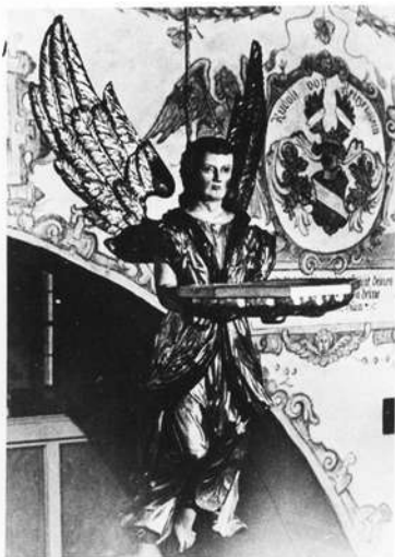
Taufengel des Wolfgang Adam Knoll 1769

Hof: Mit einem Kostenaufwand von rund 600.000 Mark wurde die alte Wehrkirche von Köditz, einem Dorf unmittelbar vor den