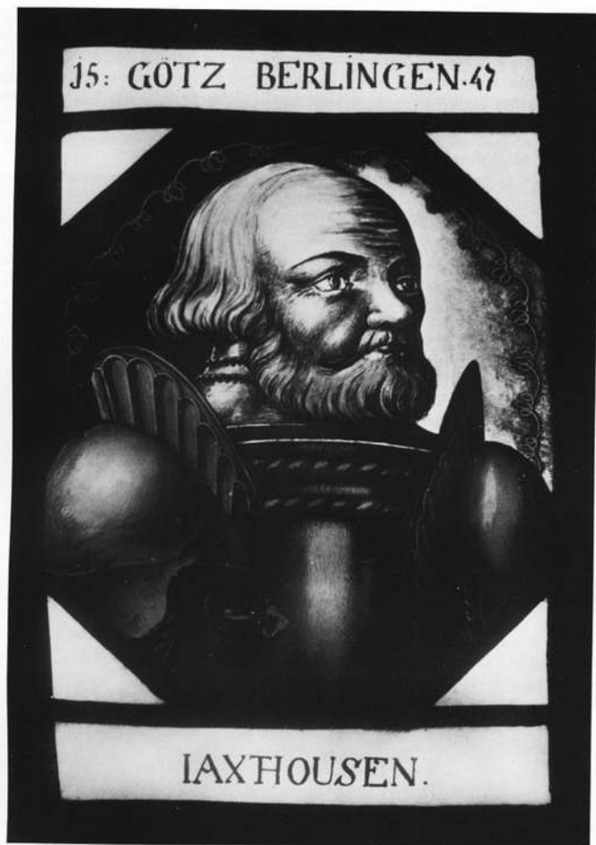
Götz von Berlichingen. Originalglasbild von 1547, Schloßmuseum Jagsthausen