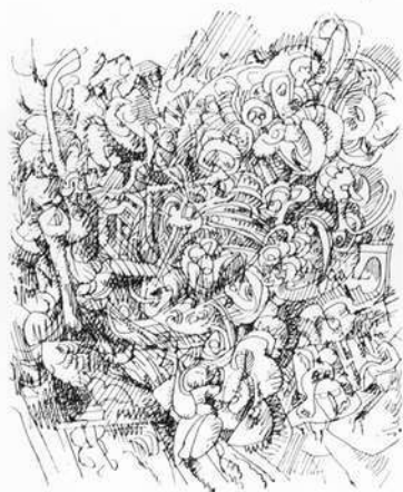
Landschaftliche Struktur (Federzeichnung)

wurden ihm: Cezanne (Form ist gleich Farbe, Bildarchitektur, Fläche, Farbraum), Baumeister (Stofflichkeit, Material und Entstehung von Formen, Metamorphosen), Kandinsky (Weg von der Landschaft zur Abstraktion). — Von größter Bedeutung ist für ihn die Rhön-