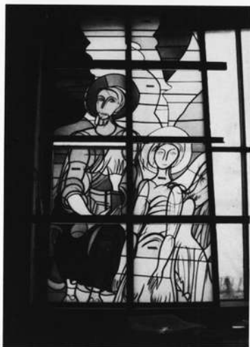
Werkstattfoto May: Evangelisten-Fenster (Matthäus), Kath. Pfarrkirche Rottershausen, 1977

landschaft, die er in vielen Wanderungen in sich aufnahm und schätzen lernte. Aus ihr wachen ihm Motivationen für seine freien Arbeiten zu, wie: Organische Formen, Relief, plastische Masse und Raum, Dynamik, Licht, Kosmos, zeichnerische und farbige Strukturen. Diese künstlerischen Erfahrungen findet man auch in seinen Glasfenstern wieder. May wörtlich: „Aus dem Licht des Raumes außer-