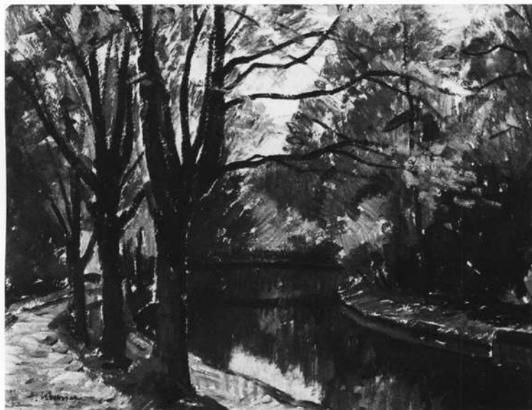
An der Tauber (Öel)

nicht an die Natur?“ sagt er. Seine mit Farbe und Pinsel erlebten Landschaften: stille Wege am Waldrand, idyllische Bachläufe, einsame Bäume, Ausblicke ins weite Hügelland, teilen sich eindrucksvoll dem Betrachter mit; ebenso