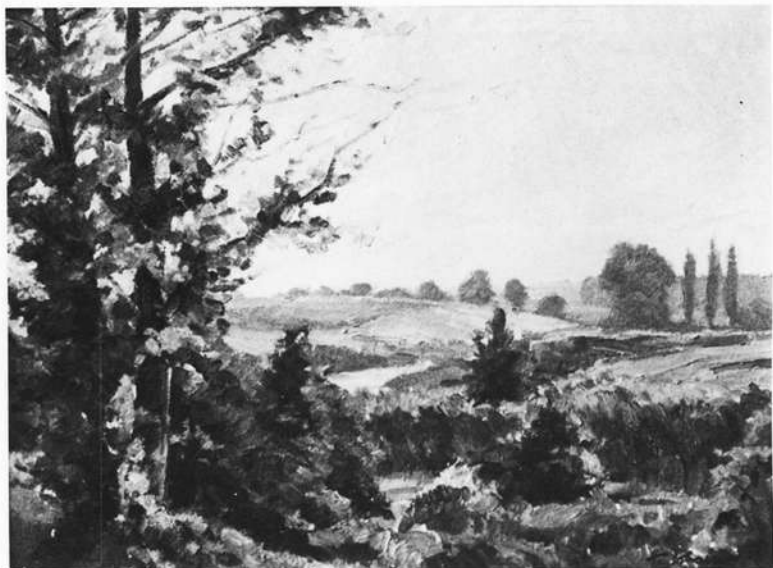
Sommerliche Landschaft (Oel)