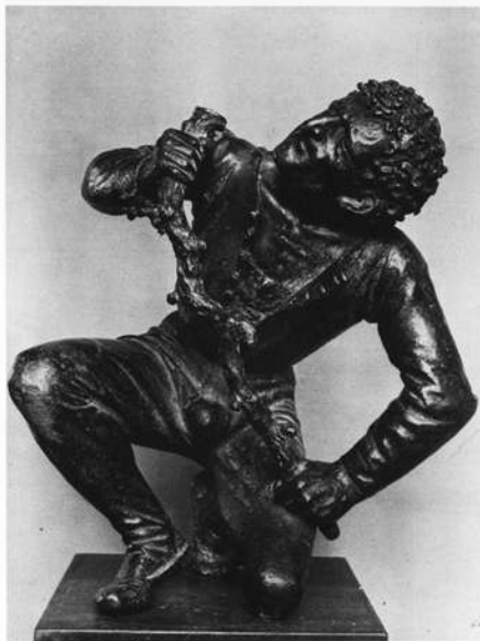
Der Astbrecher. Bayerisches Nationalmuseum München.

Muß der Mann, dessen künstlerische Handschrift man jetzt nur als Durchschnitt auf den Grabsteinen bezeichnet, nicht dennoch künstlerisch befähigt gewesen sein, um die Qualität seiner Modelleure, wie Krafft, der Entwurfszeichner, wie Dürer, und deren Eignung für die Produkte seiner Handwerkskunst beurteilen zu können? Mußte er nicht die Idee des