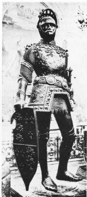
Innsbruck: Hofkirche — König Artus am Maximiliansgrab