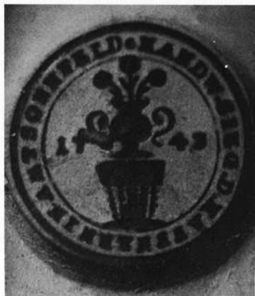
Sonnefelder Hafnersiegel von 1743