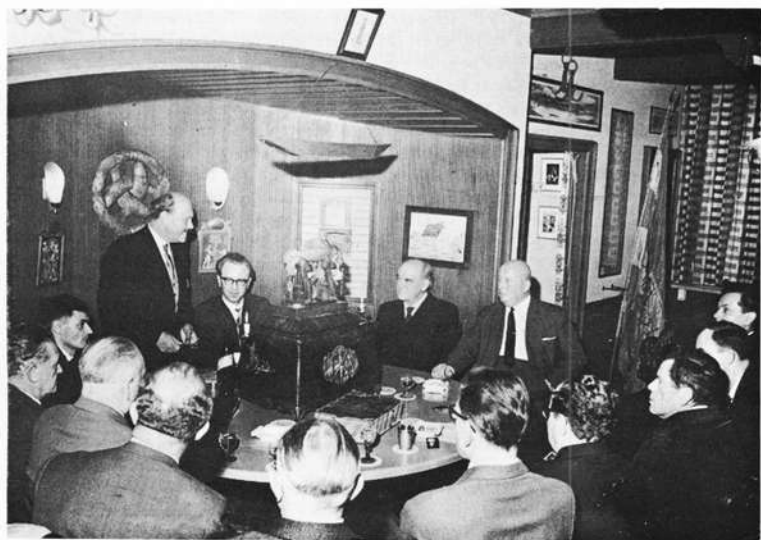
Die Fischer und ihre Freunde in der Zunftstube.

Staatsexamen und die Promotion 1937 folgte die klinische Ausbildung am Julius-Hospital in Würzburg und am Landeskrankenhaus in Detmold. Gerade konnte er noch 1939 eine Landarztassistentenstelle in Maroldsweisach antreten, dann holte ihn die Wehrmacht. Als Stabsarzt und Chef einer Luftwaffenärztsstaffel machte er den II. Weltkrieg bis zum Ende mit. Aus französischer Kriegsgefangenschaft entlassen, betätigte er sich 1946 als Hilfsarbeiter beim Wiederaufbau des Mainfränkischen Museums in Würzburg und ließ sich