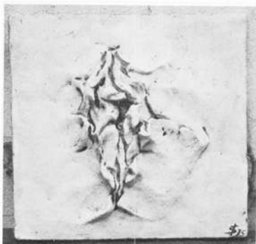
Relief auf einem Gehweg

eins. Selten entsteht bei ihr daher eine gelungene Grafik, ein koloriertes Blatt, die sie nicht alsbald in dreidimensionale Greifbarkeit, nämlich in Gebilde aus Terrakotta, umsetzt. Hier reicht die Spannweite ihres Schaffens hinüber in den Bereich der Gebrauchsgegenstände. Doch sie beherrscht die Kunst, Funktionsgerechtigkeit ohne falsche Kunstgriffe in Anmut zu kleiden und das Zweckmäßige als schön erscheinen zu lassen. Tongefäße mit elementarer Bemalung, Konsolen und Leuchter im selben Material: alles gleicht sich in der Gediegenheit einer wohlthuend einfachen Formensprache.