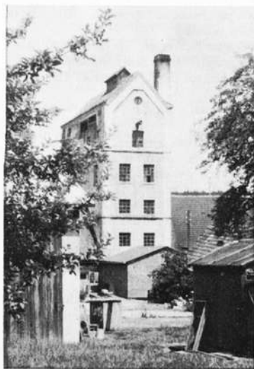
Typisches Brauhaus aus der Zeit der Jahrhundertwende (Obersulzbach)