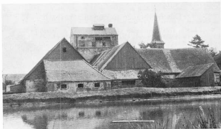
Brauhaus auf dem Lande (in Obersulzbach)

„Weinberg“ in einer Reihe von Gemeinden (Bonnhof, Bürglein, Hainklingen, Hennenbach, Großhaslach, Leutershausen, Rügland, Sondernohe usw.), zeugt davon, daß dort, hauptsächlich von den zehnt- und fronberechtigten Herrschaften, der Weinbau im großen betrieben wurde. So wurden z. B. in Bonnhof über 100 Morgen Weinberge durch das Kloster Heilsbronn bewirtschaftet; nachdem es jedoch 1578 aufgelöst worden war und sein Besitz dem Markgrafen zufiel, wurde der dortige Weinbau im Jahre 1591 eingestellt. In dem Nachbardorf Bürglein wurde im 16. Jahrhundert ebenfalls Weinbau betrieben, aber dann auf den Anbau von Hopfen übergegangen. Urkundlich bewiesen ist auch, daß seinerzeit in Lichtenau (Pflegeamt der Freien Reichsstadt Nürnberg) sogar Rotwein angebaut wurde.