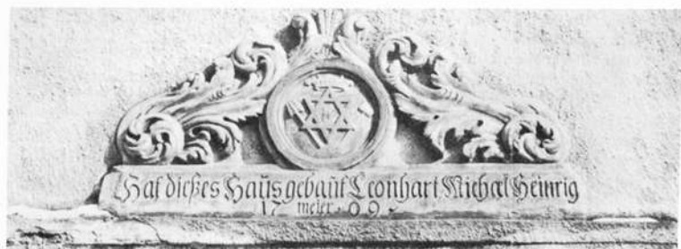
Berufszeichen der Bierbrauer über dem Türsturz des Zuganges zur Brauerei des Gasthauses „Alte Post“ (in Leutershausen)