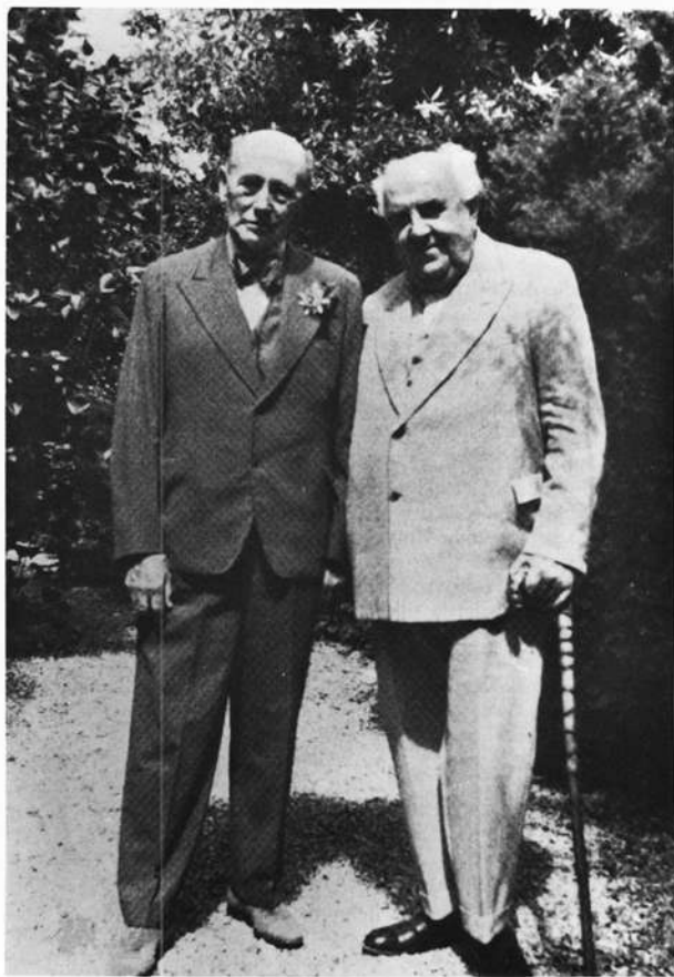
Bô Yin Râ und Felix Weingartner (links) im Jahre 1941

In einer Stringenz, die ihre Bestätigung in Form und Substanz aus sich selbst gebiert, wird der Mensch auf die ihm einzig begreifbare Wahrheit verwiesen als Ausgangsort allen seinen Erkenntnisstrebens: die Wahrheit deiner selbst. Wenn aber jeder einzelne die ihm faßbare