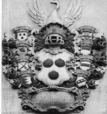
Genealogiewappen derer von Eyb