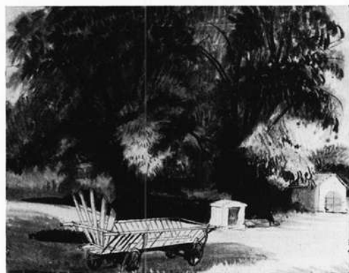
Linden von Kalteneggolsfeld Aquarell

bei Bamberg, hat er an das Germanische Nationalmuseum Nürnberg abgegeben. Schöne Bronzefunde von der Lichteneiche (Gde. Memmelsdorf, Ldkr. Bamberg) erhielt das Historische Museum Bamberg. Und Bilder hängen an den Wänden: altmeisterliche aus Familienbesitz, ergänzt durch wichtige Neuerwerbungen – und von ihm selbst.