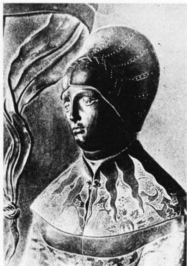
Bronzerelief der Elisabeth von Brandenburg, Gemahlin Hermanns VIII. (Sarkophagdeckel, Ausschnitt)