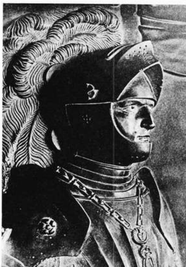
Bronzerelief des Grafen Hermann VIII. (Sarkophagdeckel, Ausschnitt)