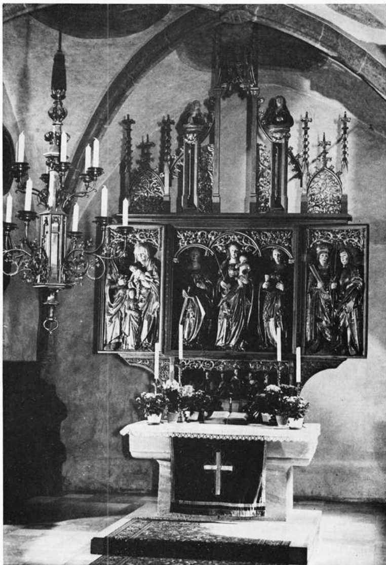
Neunhof, St. Johannis, Kanzel

Ende. Neunhof wurde nun mit der Pfarrei Beerbach vereinigt, was zugleich die Einführung der Reformation im Orte bedeutete.