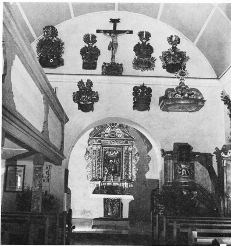
Kirche Beerbach, Chorraum mit Hochaltar