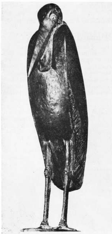
„Marabu“ (Bronze)

Am 17. November 1922 in Frankfurt geboren, erlernte er nach dem Schulbesuch das Schlosserhandwerk und machte seine Gesellenprüfung als Maschinenschlosser, und anschließend auch noch als Schreiner. In der Freizeit jedoch griff er zum Schnitzmesser und zu einem Stück Holz. Damit hat er sich auch während des Krieges den Lazarettaufenthalt erträglicher gemacht und Schnitzen und Modellieren sind ihm auch heute noch „liebste Freizeitbeschäftigung“; mit dem Unterschied allerdings, daß zum Holz auch Ton und Bronze als Material gekommen sind. Besuche von zoologischen Gärten und Reisen in afrikanische Tierreservate boten ihm eine Ergänzung zu den Tieren, die er hierzulande beobachten und darstellen konnte. Später kamen noch weibliche Figuren hinzu und Opferstöcke für moderne Kirchen.