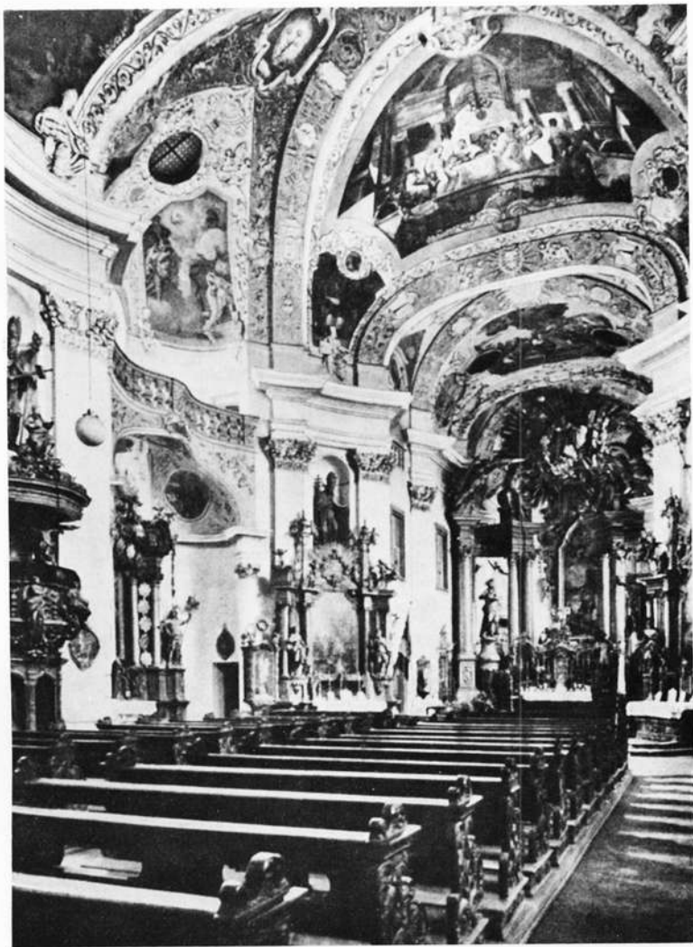
Inneres der Schloßkirche Banz

Eindruck des musikalisch Beschwingten, des Einklanges von Stein und Stuck in die Lobpreisung Gottes. Der Grundriß deutet mit seinem elliptisch kurvenartigen Ovalraum auf das Vorbild Guarino Guarini. Dieser war als Philosoph und Mathematiker ebenso bekannt wie als Architekt. Dem Auge allein erschließen sich seine diffizilen Raumkompositionen kaum, sie fordern mathe-