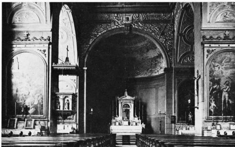
Aschaffenburg Jesuitenkirche – Inneres v. W. (vor der Zerstörung 1945)