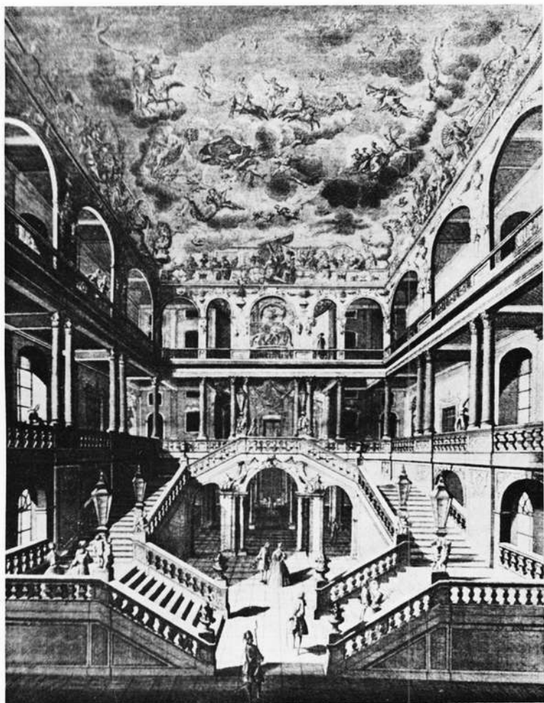
Schloß Pommersfelden im 18. Jahrh. Salomon Kleiner: Hauptstiege

lerischer Offenbarung versetzt werden. Einschlägige Intuition in der Planung und Sorgfalt im handwerklichen Teil der Ausführung sind nicht allein an Johann Dientzenhofers großen Bauten feststellbar, zu denen noch das Schloß in Kleinheubach, das er nicht vollenden konnte, die Mitwirkung an der Planung der Residenz in Würzburg und den Plan zur grandiosen Barockfassade vom Neumünster gehören. Die Gültigkeit solcher Eigenschaften generell, zeigt als Beispiel für den bürgerlichen Bau das Haus Concordia in Bamberg. Hierin begegnen sich nicht nur Großartigkeit der Anlage mit Einfühlung in die