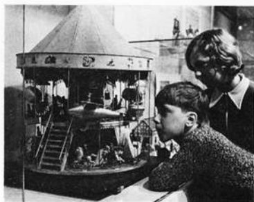
Arbeit eines Fürthers

Vielfältig ist die Zahl der Baukästen, Bausteinspiele und Holziespiele, die auch in den Vitrinen des Erdgeschoßes untergebracht sind. Auch hier gibt es Raritäten: „Schwarzwald-Baukasten“ der Firma S. F. Fischer aus Oberseiffenbach im Erzgebirge um 1910 und einen weiteren Baukasten mit der lateinischen Inschrift „Orbis Laboris“. Wie vorsichtig müssen diese Erzgebirglerhände zugefaßt haben, als sie die unglaublich kleinen, in Zündholzschachteln verpackten Kleinst-Baukasten aus Holz geschnitzt haben. Einer von ihnen, in einer Streichholzsachtel eingeschlichtet, ist aus einer Burgdorfer Baukastenfabrik und trägt die Jahreszahl 1960.